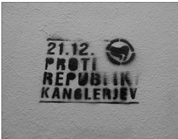
Grafit 21. december 2012 – proti republiki kanglerjev

Ti in številni podobni grafiti/nalepke so pozivali k organiziranju, nanašali pa se niso zgolj na vstajniški čas in posamezne proteste, temveč so nagovarjali k dolgoročni (samo)organizaciji onkraj obstoječega sistema. V anarhističnih/avtonomističnih krogih je koncept samoorganizacije vgrajen v same temelje in se kot praksa vsak dan uveljavlja v raznolikih kolektivih (bodisi prek DIY , food not bombs , skvotiranja