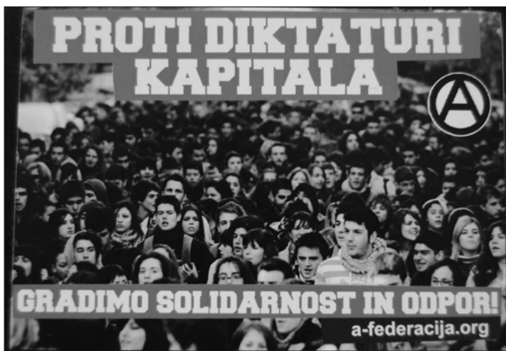
Nalepka Proti diktaturi kapitala gradimo solidarnost in odpor

Skladno z nasprotovanjem obstoječi sistemski ureditvi je veliko uličnih zapisov/nalepk nastalo kot odgovor na policijsko nasilje in represijo državnih organov nad vstajniki. 8 Policija je na nalepkah in grafitih predstavljena kot sistemski lakaj,