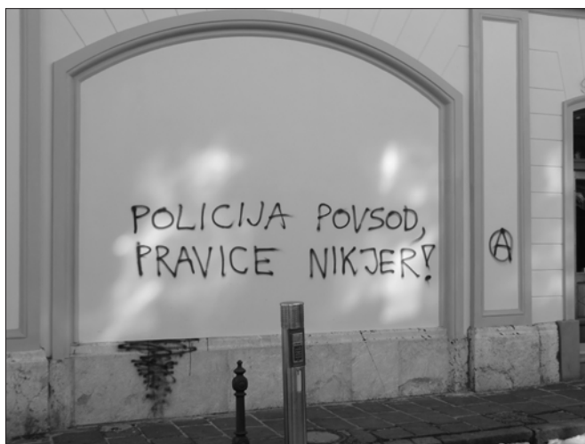
Grafit Policija povsod, pravice nikjer

in strank (tudi tistih v nastajanju): Ne rabimo nove vlade, ampak nov način odločanja in Moč ljudem, ne strankam, Nikoli sluga, nikoli gospodar! ali pa Kapitalizem na referendum! #Vstaja , z anarhističnim A. Nalepke so bile večinoma v (anarhistični) rdeče-črni kombinaciji. Strankarski sistem je bil skozi